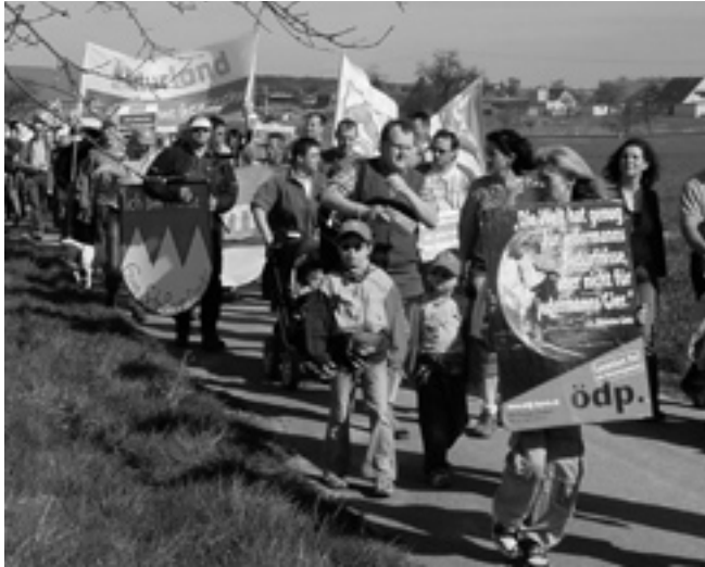
ödp-Ostermarsch zum Genmaisfeld, 2007 Landkreis Kitzingen

Forscher isolieren einzelne Gene aus anderen Organismen und setzen sie in das Erbgut von Pflanzen ein. Durch diese genetischen Informationen produzieren die Pflanzen Stoffe, welche sie resistent gegen Schädlinge, Umwelteinflüsse und bestimmte Agrarchemikalien machen sollen.